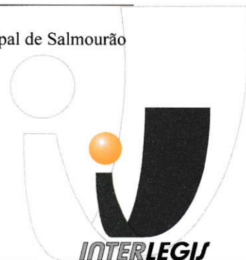
Representante da Câmara Municipal de Salmourão